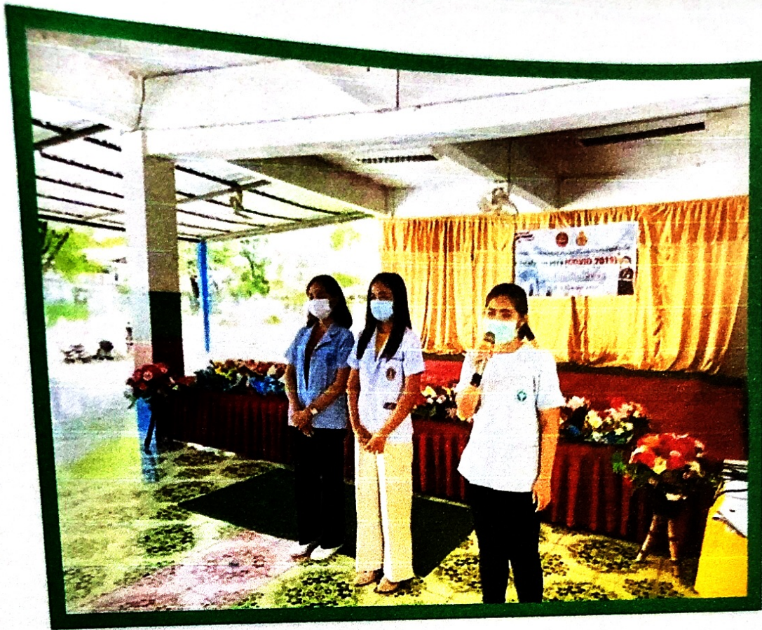
การสร้างภูมิคุ้มกันป้องกันโรคติดเชื้อไวรัสโคโรนา 2019 (COVID-19) อบรมให้ความรู้จากวิทยากร รพ.สต.โนนอุดม